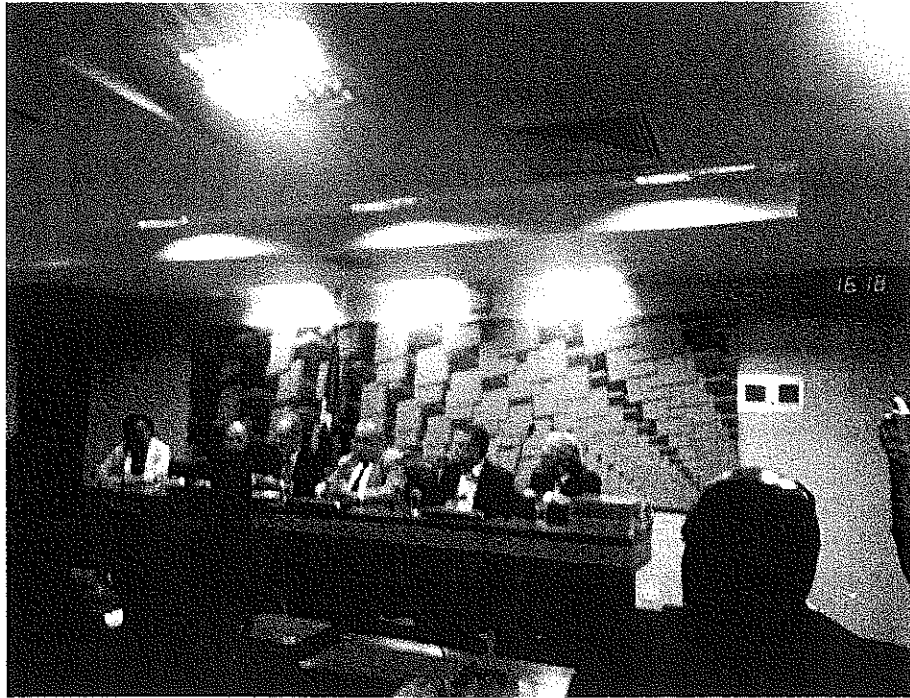
Presentación del Ministro de Ciencia, Tecnología e Innovación, del Brasil

Dando cumplimiento a mi encomienda legislativa, informo del resultado de la misma.